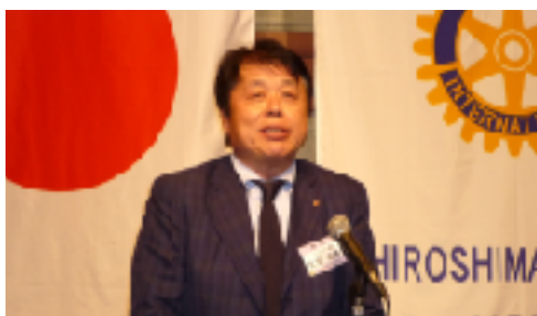
久笠グループ7 ガバナー補佐