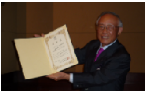
米山記念奨学会寄付総額賞第1位