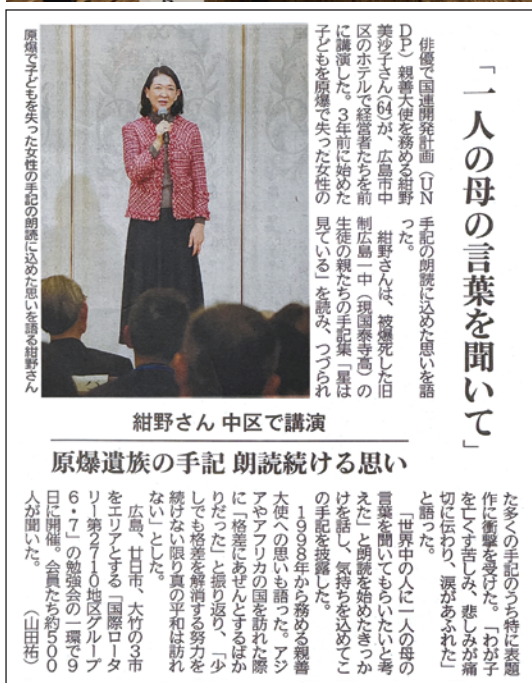
2025年(令和7年)2月12日(水) 中国新聞掲載分