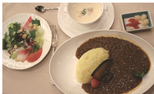
本日は100万ドルの食事例会です

100万ドルの食事は丼もいいけど、やっぱりカレーがいいなって、メニューのことを考えている人はいないでしょうか？