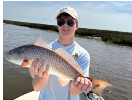
家族と一緒に人生初の釣りも体験しました!