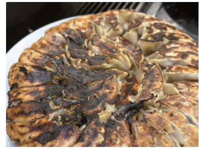
家族に餃子をふるまってみました!