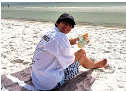
フロリダのビーチに行きました!!

4月中に念願のNBAを見に行くために、オクラホマ州へ旅行しに行く予定です。地元チームのホームゲームではありませんが、僕の通っている学校を卒業した選手が相手チームにはいるのでとても楽しみで待ちきれません。