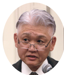
職業奉仕委員会 委員長