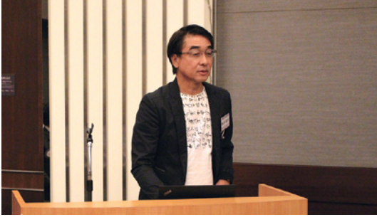
A.T. カーニー日本法人 会長 / CIC Japan 会長