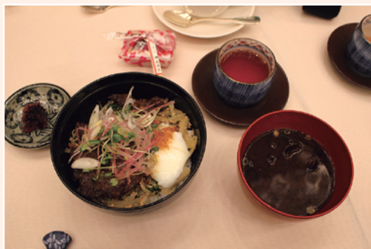
本日は100万ドルの食事例会です