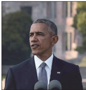
2016.5.27 オバマ大統領による 広島スピーチ

被爆当時の町の再現（だけではないが）のため調査を重ねるうち、重大な証言が得られる。