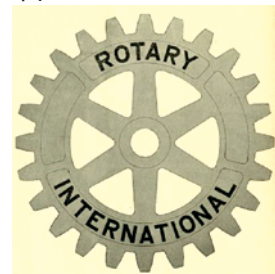
くさび穴がないロゴ