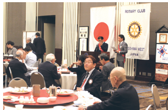
例 会 風 景

最後に卓話企画は広く、随時募集しております。皆様の絶大なるご協力をお願いします。