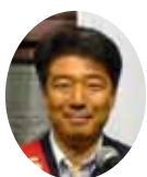
S A A 大 植 伸 理事・委員長

誕生日プレゼント、事前アンケートでご希望の商品を3つの中から選んで頂きましたが、なんと、丁度良く3等分に分かれました。第1回目のIMで出たアイデアが早速、実を結んだと喜んでいるところです。この次は、今月30日に開催される夜間例会inうを久。明日、第4回目のIMを開き着々と準備を進めてまいります。今後は、2回の夜間例会、クリスマスイブ当日の家族同伴夜間例会、家族会等々、会員皆様の親睦そして、RCの親睦を深めて頂く行事が続きます。その中でただ一つ、ただ一つだけ皆さんにご理解とご協力を頂きたいことがあります。それは、何をやるにしても全員のご希望に沿えない場合が必ずあります。その時は、どうぞお許しください。ということ、一方的にお願いをしまして、委員長就任の挨拶とさせていただきます。1年間宜しくお願いいたします。